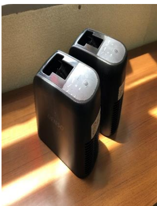
▲車両用クレベリン装置