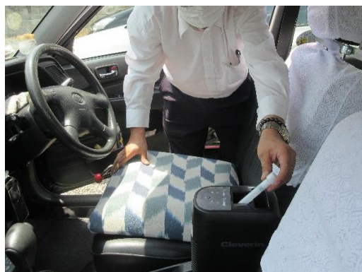
▲車両用クレベリン・作業の様子(タクシー)